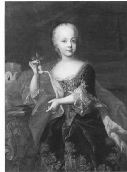
Erzherzogin Maria Anna als junges Mädchen, um 1747, vermutlich Martin van Meytens, Öl auf Leinwand, 96 x 74,3cm, Inv. Nr. 138