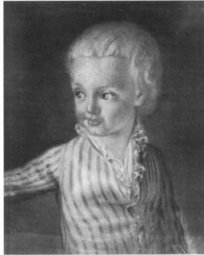
Ferdinand (III.), Großherzog der Toskana, um 1773, nach Wenceslaus Werlin, Pastell auf Papier, 44 x 35,5 cm, Inv. Nr. 75