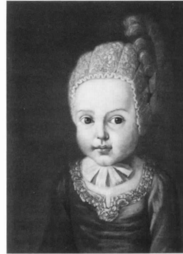
Carl Ludwig, Erzherzog von Österreich, um 1773, nach Wenceslaus Werlin, Öl auf Leinwand, 44 x 36,5 cm, Inv. Nr. 133