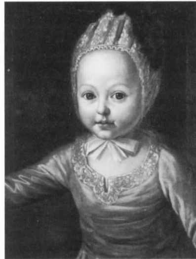
Carl Ludwig, Erzherzog von Österreich, um 1773, nach Wenceslaus Werlin, Öl auf Leinwand, 44,5 x 36,8 cm, Inv. Nr. 14

Clemens Wenzeslaus von Sachsen, Erzbischof von Trier, in ihre Sammlung auf, womit sie laut Yonan erneut von der Präsentation der Kernfamilie abwich (33).