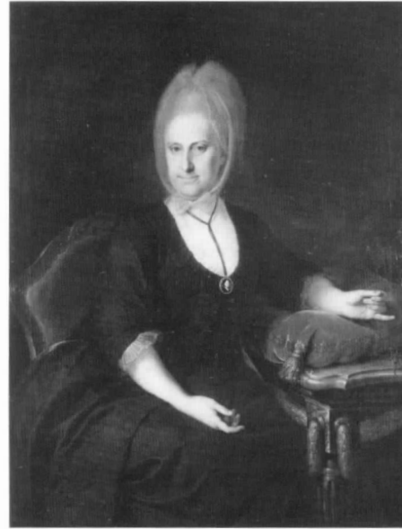
Johann Baptist Lampi, Maria Anna, Erzherzogin von Österreich , 1781, Öl auf Leinwand, 126 x 95cm, Inv. Nr. 270

wichtigen Teil der repräsentativen Inszenierung darstellten. Bereits zu Lebzeiten ließ sich Franz Stephan zunehmend in Uniform abbilden, die unter seinem Sohn Joseph II. schließlich das spanische Mantelkleid als Hofkleidung ersetzte. 5